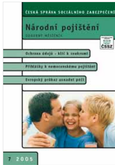
Titulní strana odborného měsíčníku ČSSZ – Národní pojištění. Jeho podoba vychází z Grafického manuálu ČSSZ.

Služby veřejnosti z oblasti důchodového pojištění poskytuje také moderní call centrum. V ústředí ČSSZ vzniklo v roce 2002 a za tu dobu vyřídilo stovky tisíců dotazů klientů. Například jen v prvním pololetí roku 2005 jich bylo 81 183. Týkaly se zejména individuálních důchodových záležitostí jednotlivých pojištěnců. Podobně je vytižena i informační kancelář ústředí ČSSZ – jen v prvním pololetí 2005 ji navštívilo 29 553 lidí.