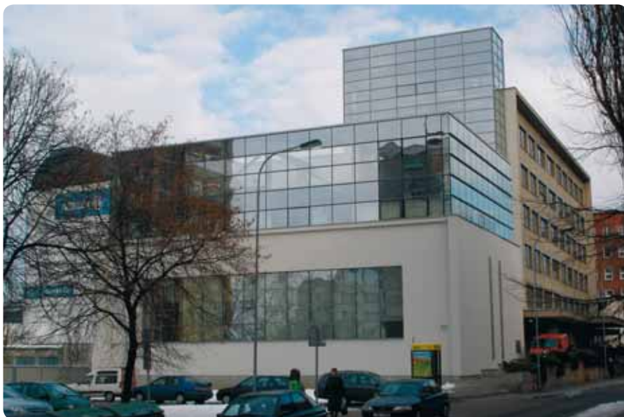
Celoživotní vzdělávání zaměstnanců ČSSZ je zárukou kvalitních služeb pro veřejnost. Proto s pomocí Evropské unie vzniklo moderní výukové středisko ČSSZ v Karlových Varech.