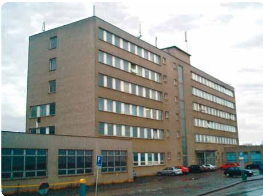
Detašovaná pracoviště ČSSZ v minulosti často sdílela budovy s dalšími orgány státní správy. Zaměstnanci tak mnohdy vyřizovali požadavky klientů v nevhovujícím prostředí. Pohled na bývalé detašované pracoviště ČSSZ v Plzni.