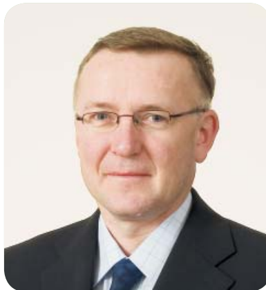
Mgr. LUBOŠ VANĚK (od 1. srpna 2006 pověřen řízením ČSSZ)